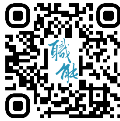
臺北市職能發展學院 官網